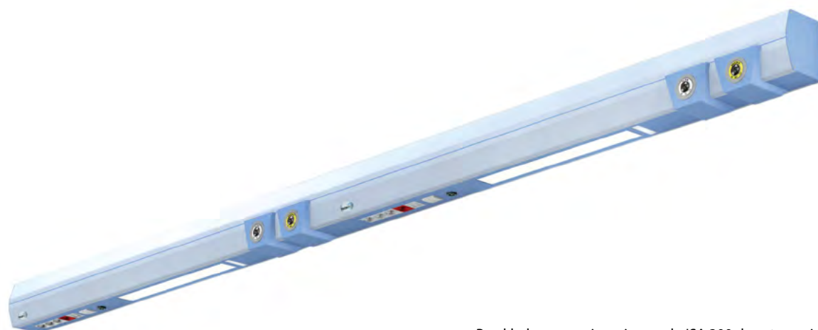
Przykładowe rozwiązanie panelu ISA 300 dwustanowiskowego

Standardowa długość panelu jednostanowiskowego: 1600 mm